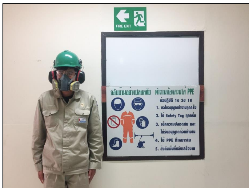
แสดงการสวมใส่อุปกรณ์ PPE