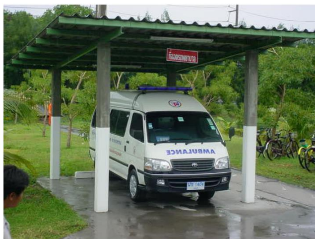
รถพยาบาล