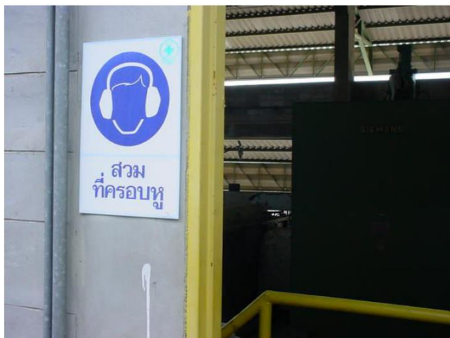
ป้ายเตือนให้ใส่อุปกรณ์ป้องกันเสียง